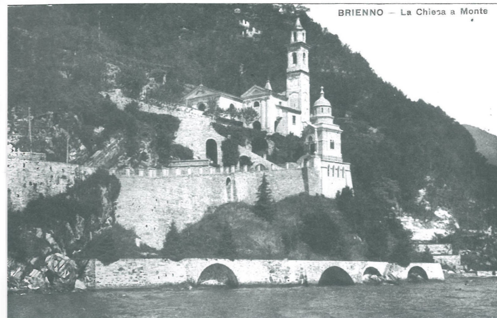
BRIENNO — La Chiesa a Monte

La terrazza degrada leggermente verso nord con un espediente quasi teatrale ad accelerare prospetticamente il paesaggio; verso il paese è invece conclusa da due piccoli volumi (uno per i servizi igienici, il secondo per la scala di accesso al livello sottostante con magazzino e attracco delle barche) interamente rivestiti in legno. Semplicità, integrazione e rapporto con la tradizione costruttiva si ritrovano anche nelle scelte materiche per i percorsi di accesso dalla strada: scala realizzata integrando pietra locale con quella proveniente dalle demolizioni, pianerottoli in piccoli elementi di pietra posati a coltello e sentiero in ghiaietto inerbito.